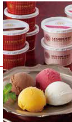
季節の果物&スイーツ P.10